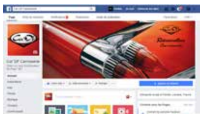
Facebook : Bandeau + Photo de Foire automnales avec votre logo à partir de 180€ HT