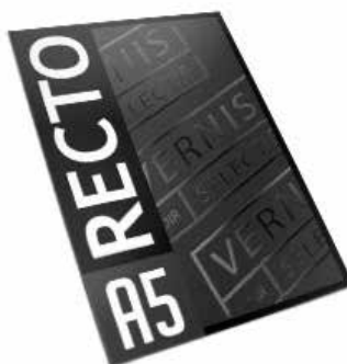
Flyer A5 présentation offre de votre entreprise à partir de 150 HT