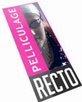
Carton d'invitation Foire avec votre Logo à partir de 75€HT