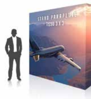
Stand Parapluie Tissu ECO 3 X 3 à partir de 250 HT