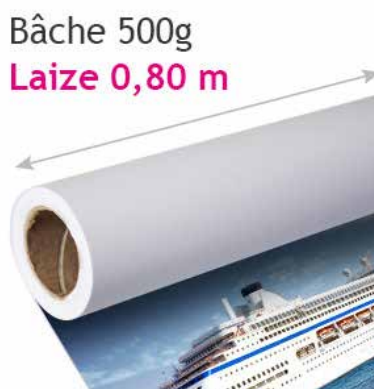
Bâche 0,80/2M à partir de 145€ HT